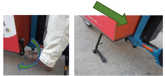
Ständer nach unten drücken, Rad nach hinten schieben.