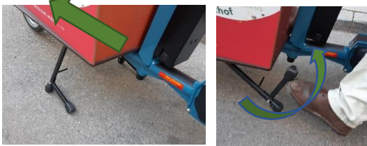
Rad nach vorne schieben, Ständer mit Schwung nach oben.